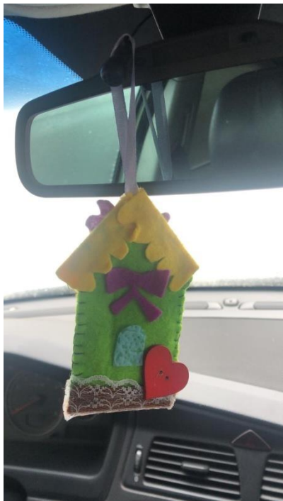
ГРУППА № 5