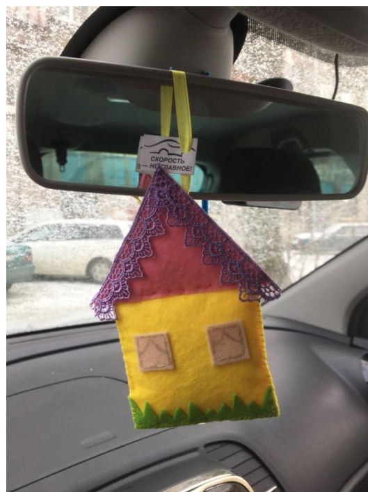
ГРУППА № 5