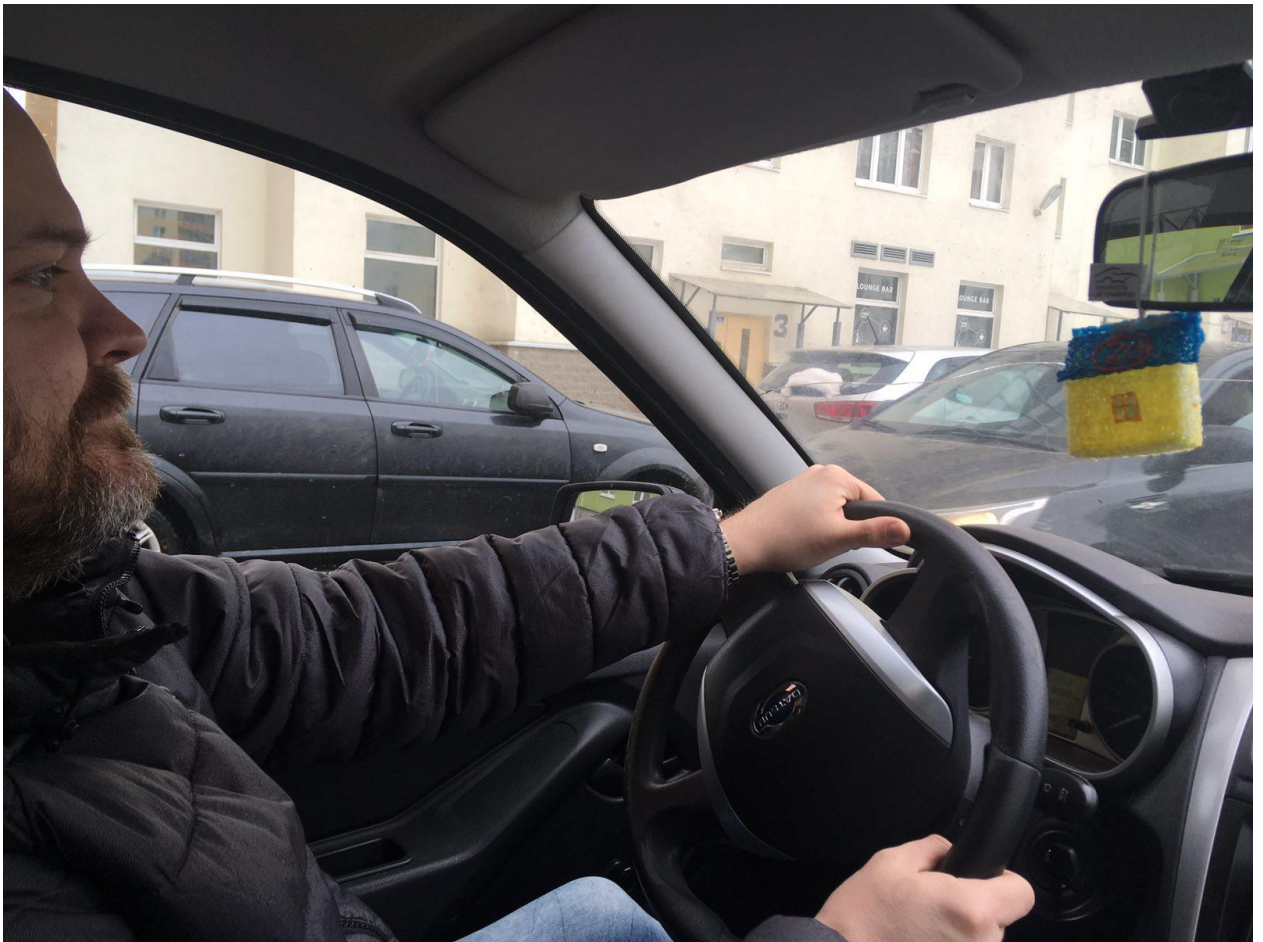
ГРУППА № 12