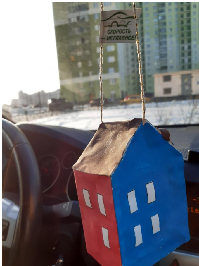
ГРУППА № 9