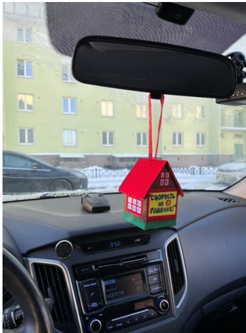
ГРУППА № 5