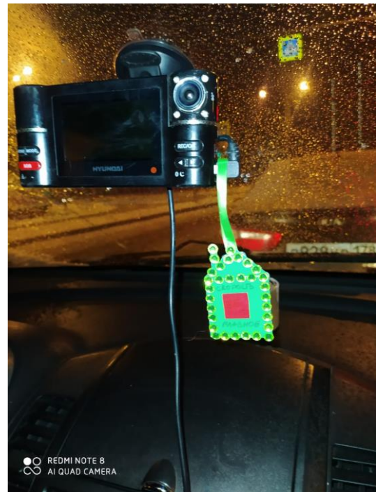
ГРУППА № 7