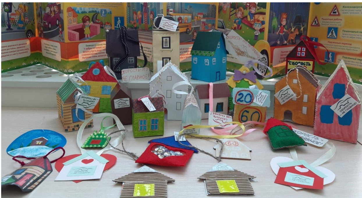
Брелоки, изготовленные в рамках акции «СКОРОСТЬ – НЕ ГЛАВНОЕ!»

В акции приняло участие 27 детей, 24 родителя и 15 педагогов. Всего было изготовлено 29 игрушки-брелока.