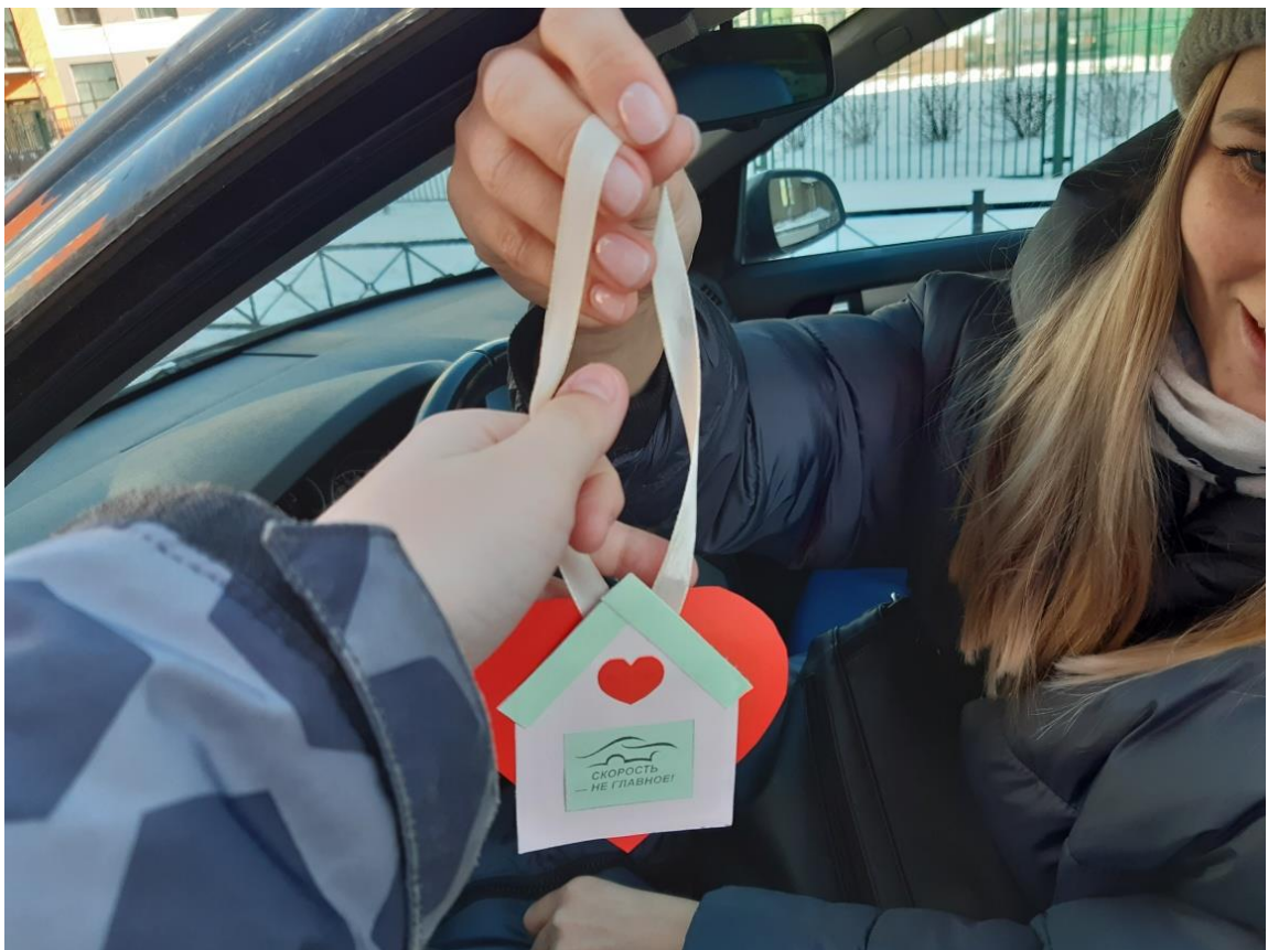
ДЕТИ ВРУЧАЮТ БРЕЛОКИ РОДИТЕЛЯМ-ВОДИТЕЛЯМ