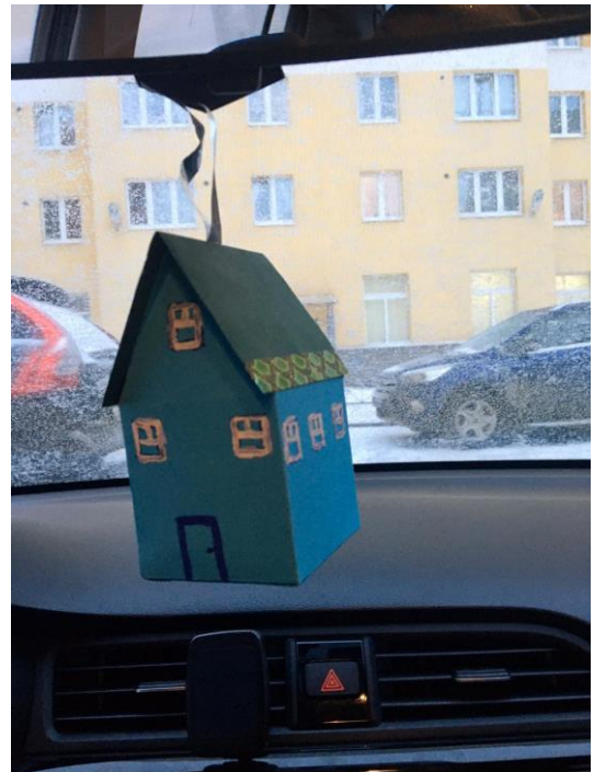
ГРУППА № 7