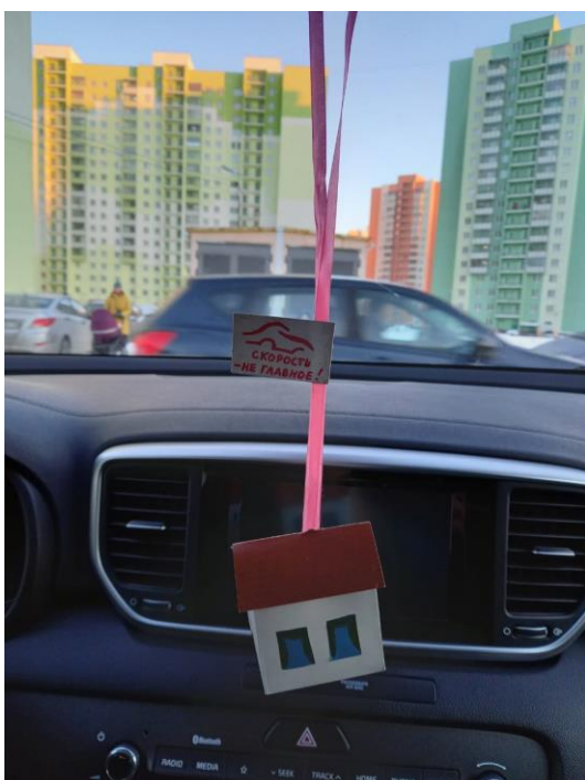
ГРУППА № 7