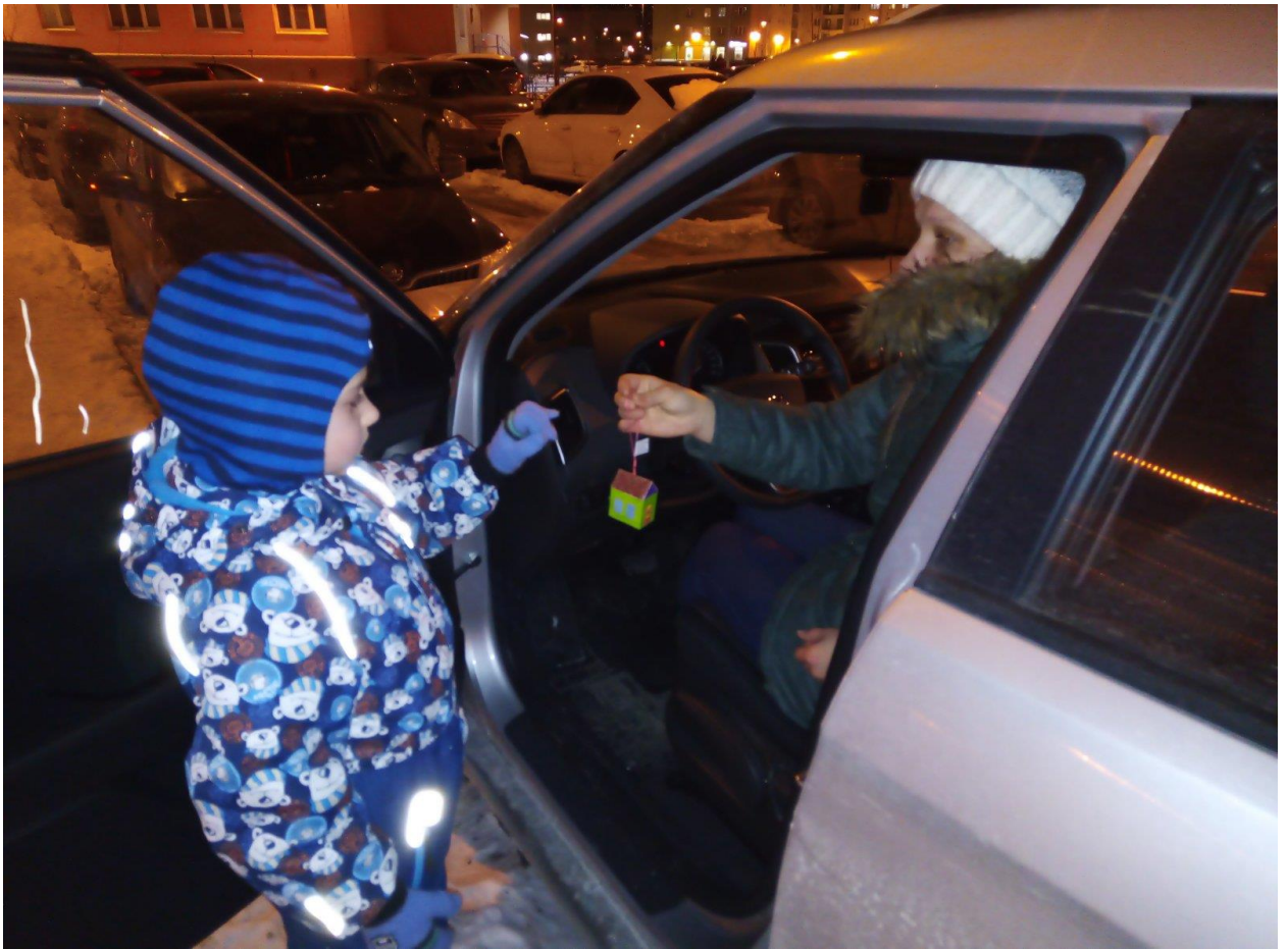
ДЕТИ ВРУЧАЮТ БРЕЛОКИ РОДИТЕЛЯМ – ВОДИТЕЛЯМ