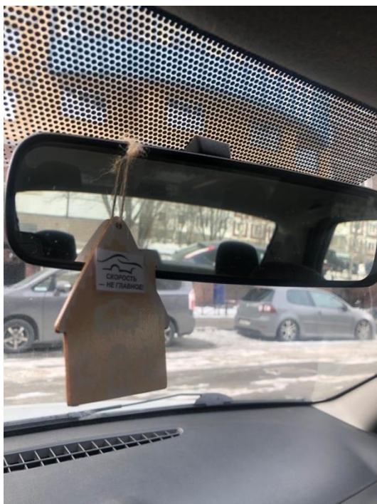
ГРУППА № 5