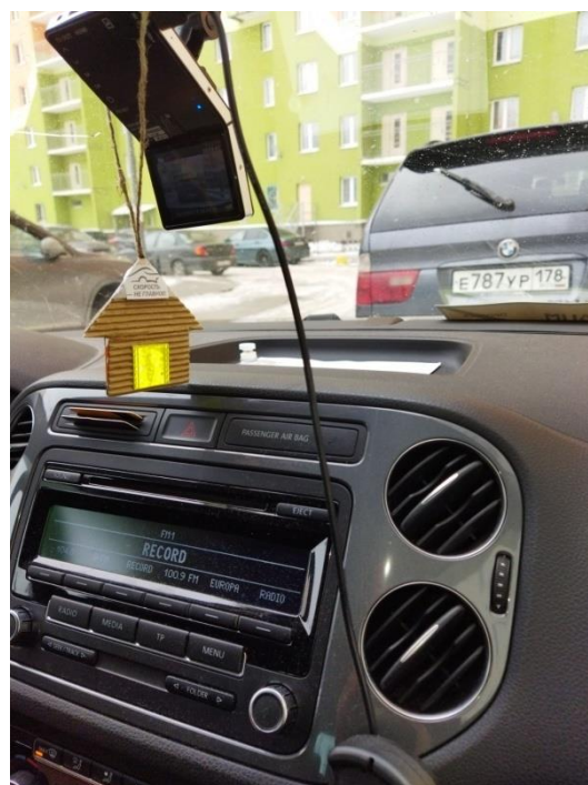
ГРУППА № 14