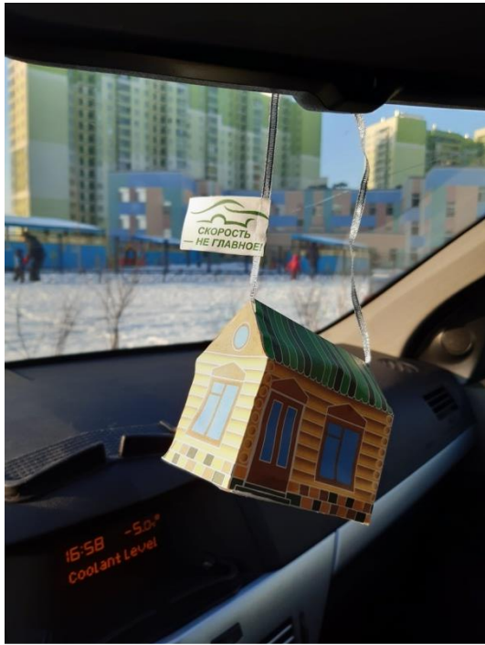
ГРУППА № 9