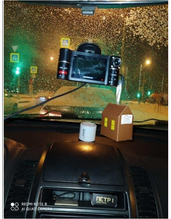
ГРУППА № 7