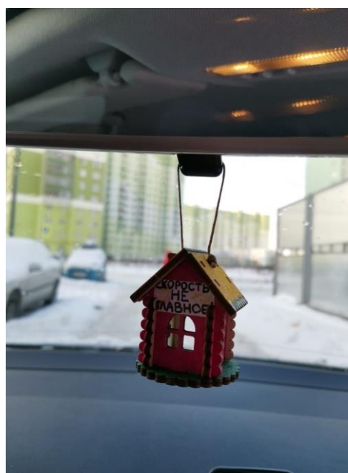
ГРУППА № 7