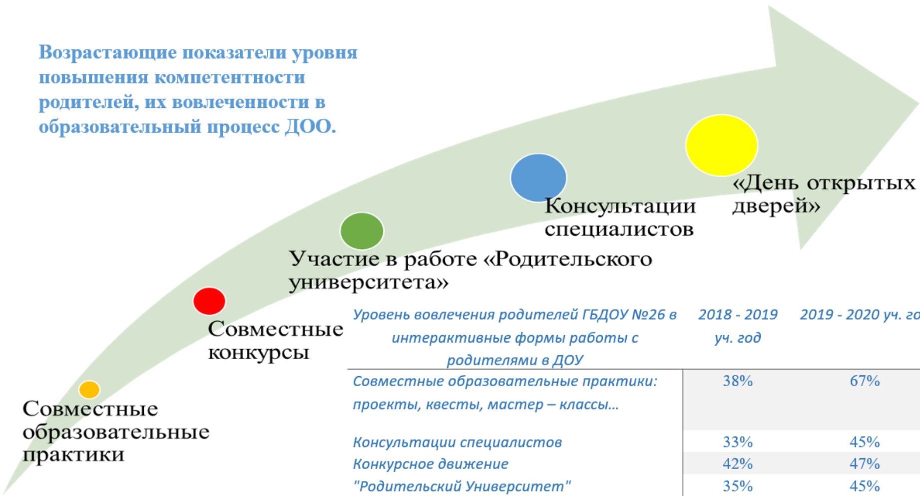
Уровень вовлечения родителей ГБДОУ №26 в интерактивные формы работы с родителями в ДОО 2018 - 2019 уч. год 2019 - 2020 уч. год

Возрастающие показатели уровня повышения компетентности родителей, их вовлеченности в образовательный процесс ДОО.