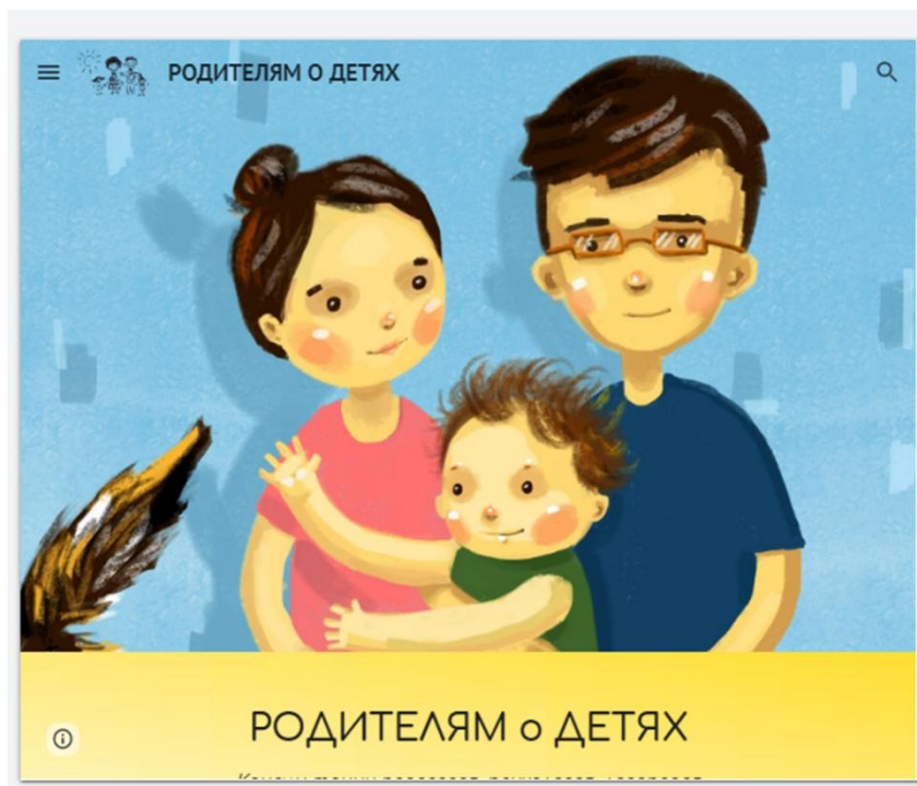
Рисунок 1. Информационный ресурс "Родителям о детях"

Информационный ресурс дистанционного взаимодействия ДОО и семей «Родителям о детях» размещен на платформе Google ( https://sites.google.com/view/roditeliam/ ).