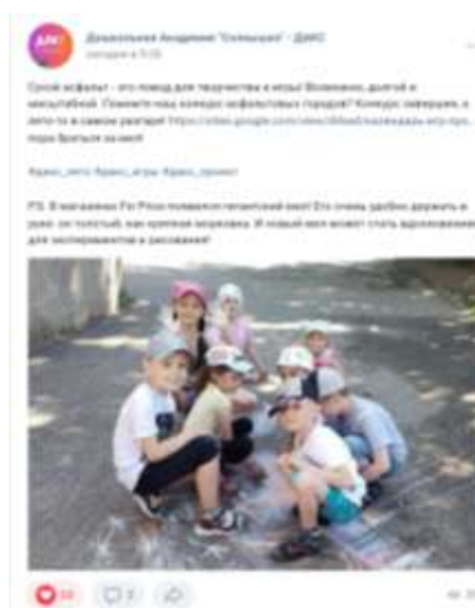
Рисунок 3. Распространение конкурса рисунков на асфальте в социальной сети "ВКонтакте" социальными партнерами, группа "ДАКС".

Узнать о ресурсах «Дистанционный детский сад» и «Родителям о детях» можно из социальной сети Вконтакте, поскольку именно в ней мы начали рассказывать о данном проекте в блогах педагогов, которые участвуют в разработке программ, в группах детских садов, задействованных в ОЭР, а также в группах наших социальных партнеров (рис. 1).