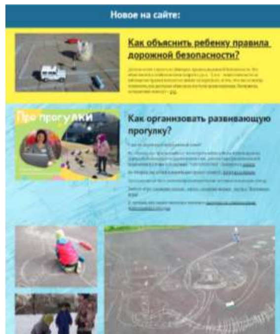
Рисунок 1. Пример комплексного ответа на вопрос о развивающей прогулке.

сад», поскольку отвечаем подборкой идей игр: Дистанционный детский сад - День города (google.com) – например, это ответ на вопрос «Нужно ли