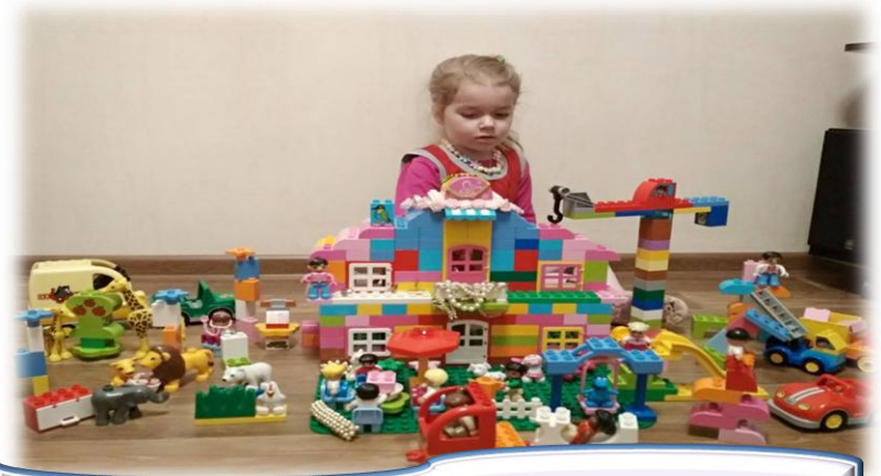
«Дача принцессы Ксении»